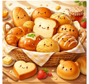
(文章摘自 2026/1 蒲公英希望月刊)