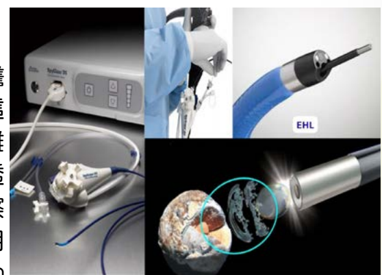
Spyglass 導管式膽道鏡導引下電震波碎石術 (SpyGlass EHL)

對於困難性膽管結石，傳統 ERCP 治療常受限。Spyglass 膽道鏡結合 EHL，可在直視下精準碎石，顯著提高清除率，降低併發症與手術風險，為患者帶來更安全有效的治療選擇。